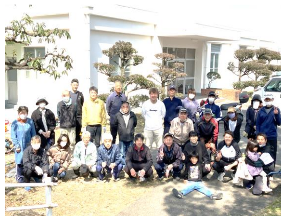
【草刈り終了後の記念撮影】

学校運営協議会制度(コミュニティ・スクール)は、学校運営及び当該運営への必要な支援に関して協議する機関として、東海市教育委員会及び校長の権限と責任の下、地域住民及び保護者等の学校運営への参画並びに地域住民等による学校運営への支援及び協力を促進することにより、学校と地域住民等との間の信頼関係を深め、学校運営の改善及び児童生徒の健全育成に取り組むことを目的として、東海市では令和8年度より各校に順次、設置していくことになりました。本校は加木屋中学校と共に、モデル校として、本年度より先行してコミュニティ・スクールを導入します。