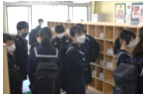
自分の靴箱を確認して…