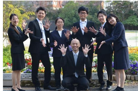
学年の先生たちです よろしくね！