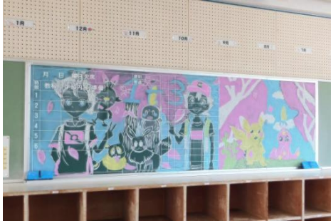
先輩方が描いた素敵な黒板アートです