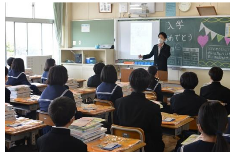
担任の先生はどんな人かな？