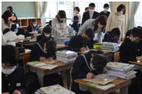
自分の持ち物に名前を書きます