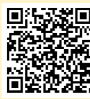
「ラーケーションカード」 (小中学生用)

あいちけん ベーじ ら-け-しょん ひ ぽ-たるさいと まな 愛知県のWebページ「ラーケーションの日」ポータルサイトには、学び たいけん すぼっと けいかく やくだ ら-け-しょん か-ど を体験できるスポットや、計画に役立つ「ラーケーションカード」などを しょうかい 紹介しています。