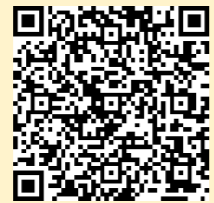
「ラーケーションの日」