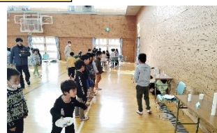
12/11 1・2年 おもちゃ遊び