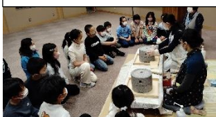
12/5 3年校外学習 平洲記念館