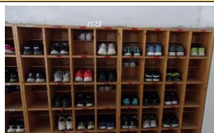
12/10 はきものそろえ週間