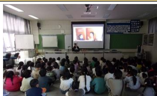
12/上旬 人権読み聞かせ