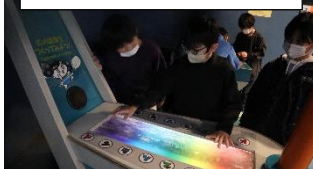
12/4 4年校外学習 半田市