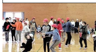
12/19 6年 学年レク