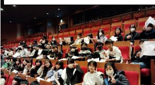
12/16 5年 劇場コンサート