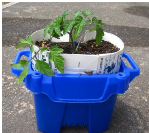
【牛乳パックを使って植えた様子】