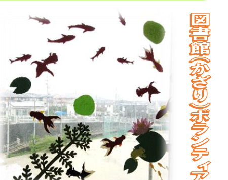
図書館(かぎり)ボランティア