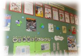
【高学年図書館前掲示板】

今年度は、6月10日～6月21日に開催しました。期間内の総貸出冊数は、3,754冊でした。一人あたり、5.57冊読んでいたことになります。期間中、最高記録の20冊となった子どもたちは16名でした。1日2冊借りることができるので、平日10日間で20冊が最高記録となります。