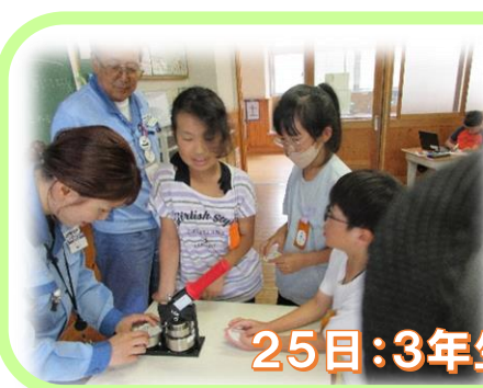
25日:3年生「日本製鉄出前授業」