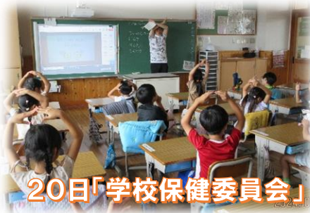
20日「学校保健委員会」