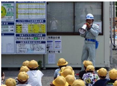
工事現場の方から話を聞きました

現在着々と校舎増築工事が進んでいます。そんな最中ですが、休工の日を利用して、3・4年生で工事現場の見学を行いました。まず工事会社の方からどのような工事を行い、どんな校舎が完成するのか説明をしていただきました。そして、実際に工事現場を見て、「ここが教室になる」「これはトイレだよ」と教えてもらい、完成する校舎を想像しながら見学しました。コンクリートが流し込まれれば見ることのできない貴重な現場を見ることができました。