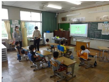
どなたし算になるんだろう