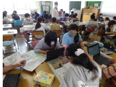
これは和語かなあ漢語かなあ