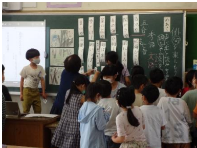
俳句って難しいなあ

今年度初めての授業参観を行うことができました。新型コロナウイルス感染防止の観点から、保護者の皆様方にはご不便をおかけしましたが、多数の方にご参加いただきました。ありがとうございました。