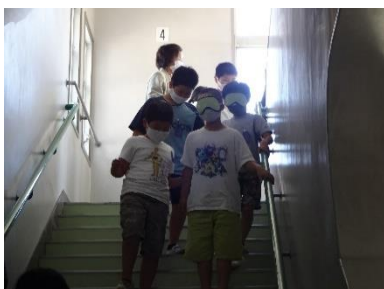
ガイドを頼りに階段の昇り降り

東海市社会福祉協議会の御協力のもと、3年生から6年生で福祉体験教室を行いました。ガイドヘルプ（3年生）、手話（4年生）、点訳（5年生）、車いす体験（6年生）に分かれ、講義と体験を行いました。目が見えない、耳が聞こえない、足が不自由であることを体験し、これからそのような障がいをもった方々に対して、自分ができることは何だろうかと考えを深めていました。