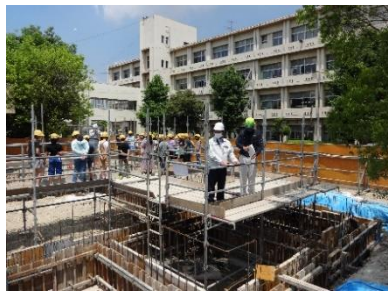
足場を通過して見て回ります