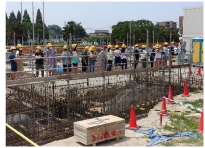
「ここが教室になります」