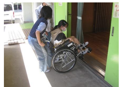
段差を超えるだけでも大変だ