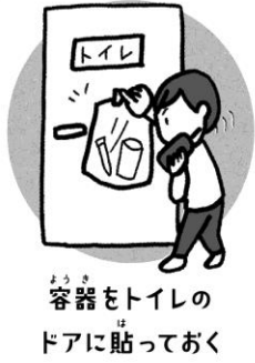
容器をトイレのドアに貼っておく