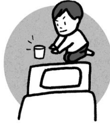
容器も枕元に置いて寝る