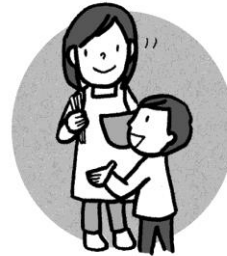
家族の人に話しておく