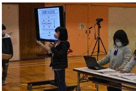
【学習発表会のようす】

将来の夢のプレゼン発表の発表順をグループで決めるとき、私は後半の司会になったし、プレゼン発表が一番最初になったので、すごくドキドキしました。また、福祉についてのプレゼンでは、たくさんの人の前でマイクを使って話しました。マイクを使うのでとても緊張しましたが、終わった後にお母さんが「良かったよ」とほめてくれて嬉しかったです。