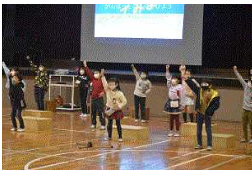
【学習発表会のようす】

私が、3学期でがんばったことは、学習発表会です。学習発表会では、がんばったことや楽しかったことの発表をしました。はじめは緊張していたけど、1年2組のみんなに勇気をもらって大きな声で発表することができました。ダンスや歌の発表をしているうちに緊張していた心がどんどん嬉しい気持ちに変わって、緊張なんか消えてしまいました。嬉しい気持ちのまま、みんなとどんぐり工作や昔遊びでお家の人たちに遊んでもらって、とてもいい思い出になりました。