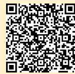
「ラーケーションの日」 ポータルサイト

※ 県の Web ページ「ラーケーションの日」ポータルサイトには、計画づくりに活用できる「ラーケーションカード」や、様々な学びを体験できるスポットを紹介していますので、参考にご覧ください。