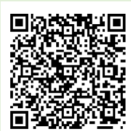
「ラーケーションの日」 ポータルサイト

「ラーケーションの日」には、いろいろなかつどう 「ラーケーションの日」には、いろいろな活動ができます。 何ができるのか、どうやって「ラーケーションの日」を取れば よいのかなど、しりたい ひと いえ ひと くば ほごしゃよう 「保護者用 リーフレット」をみたり、みぎ にじげんコード から、「ラーケーション ポータルサイト」をみたりしながら、いえ ひと はな あ 「保護者用リーフレット」を見たり、右の二次元コードから、「ラーケーションポータルサイト」を見たりしながら、家の人と話し合ってください。